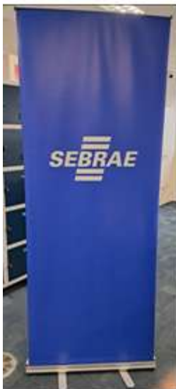
Imagem para referência, meramente ilustrativa:

3.4.1.2. A CONTRATADA deverá fornecer um modelo para aprovação do Sebrae-SP.