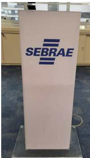
Imagem para referência, meramente ilustrativa:

3.3.1.3.2. Medidas: 1,10 m altura x 0,40 cm largura