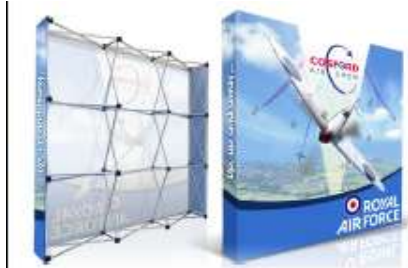
Imagem para referência, meramente ilustrativa: