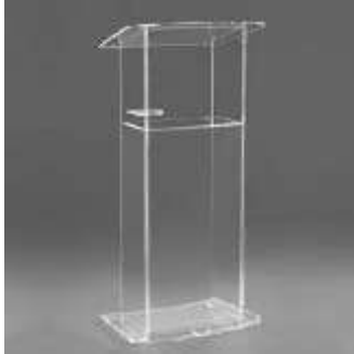
Imagem para referência, meramente ilustrativa: