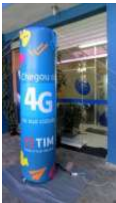
Imagem para referência, meramente ilustrativa:

3.7.2.3. A CONTRATADA deverá fornecer um modelo para aprovação do Sebrae-SP.