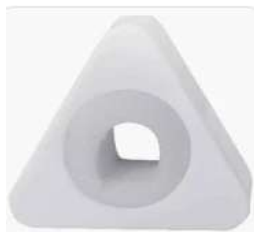
Imagem para referência, meramente ilustrativa:

3.5.1.4. Local de entrega das peças – Sebrae Sede – Rua Vergueiro, 1117 – 8º andar - Paraíso – São Paulo -SP.