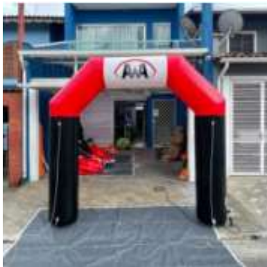
Imagem para referência, meramente ilustrativa:

3.7.1.3. A CONTRATADA deverá fornecer um modelo para aprovação do Sebrae-SP.